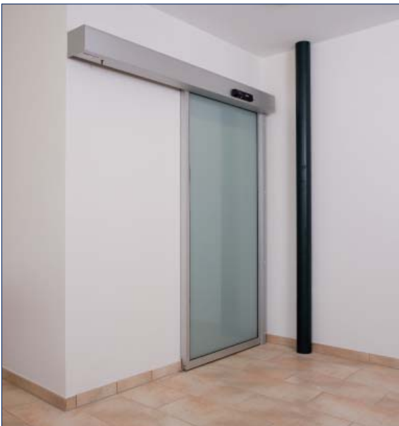
Hubertus Hotel Schluchsee