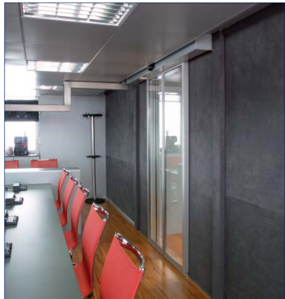
Scuderia Toro Rosso