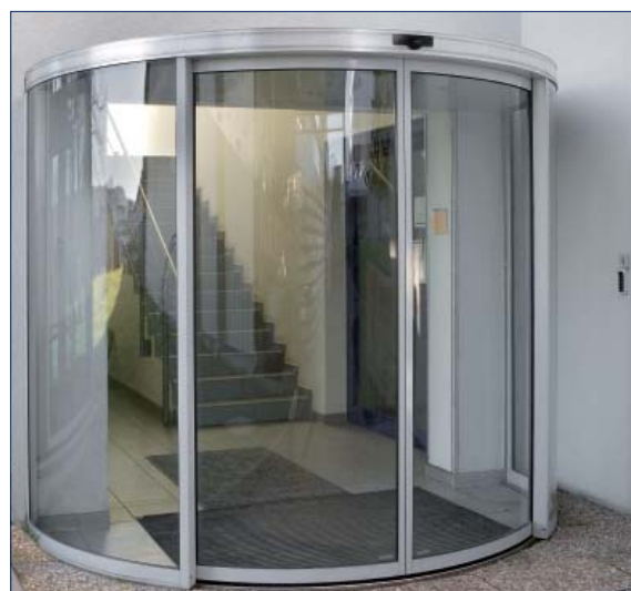
GEZE Technologie- und Entwicklungszentrum

Ύψος καλύμματος: 150 mm (με καλυμμένο πάνω πλαίσιο πόρτας)